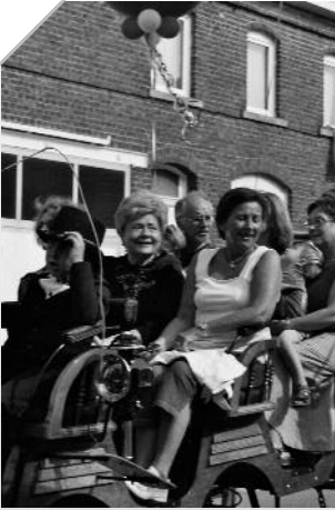
Een gelukkige burgemeester.