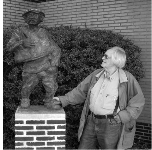
Kunstenaar en 'De Seizoenarbeider'