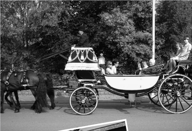
Peter en meter