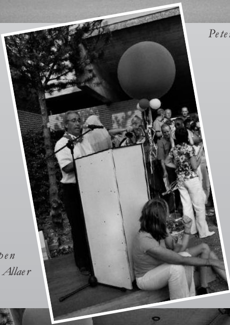
Schepen Wim Allaer