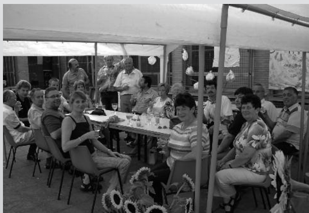
Werkgroep 'Heldergem Beeldschoon'